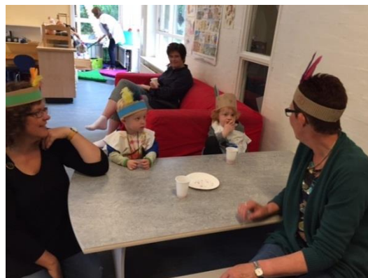
Billeder fra Værksteder og hygge på Gæstedagen