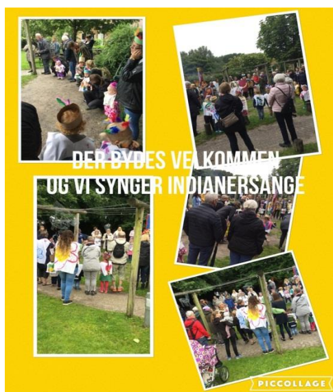
Stemmingsbilleder fra Gæstedagen

Vi fik holdt gæstedag med Indianer som tema, hvor mange bedsteforældre og andre gæster mødte frem. Der var rigtig god stemning, der blev danset og sunget, prøvet aktiviteter, fortalt og snakket. Dagen blev sluttet af med den medbragte frokost, pizzasnegle og smagsprøver på bisonkød.