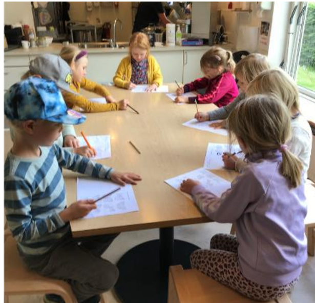
Vi laver skoleopgaver på en hjemmedag