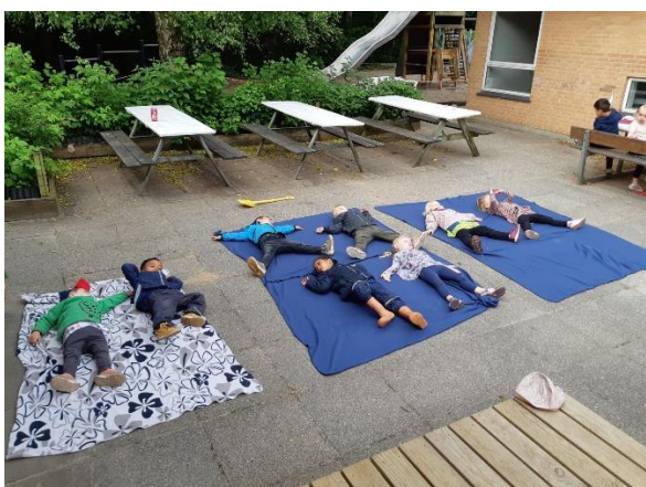
Yoga for børn