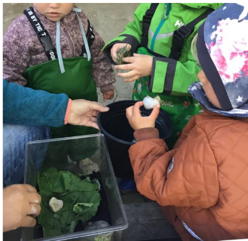
Vi har opbygget en mindre sneglefarm og fodrer sneglene og de har fået navne