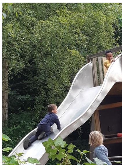
Dreungeeksprimentet. Kan du komme her op? Legepladsbesøg og nye udfordringer