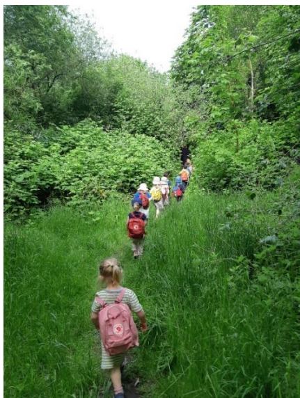
På tur ud i det grønne