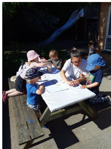
Vi tegner og maler på legepladsen