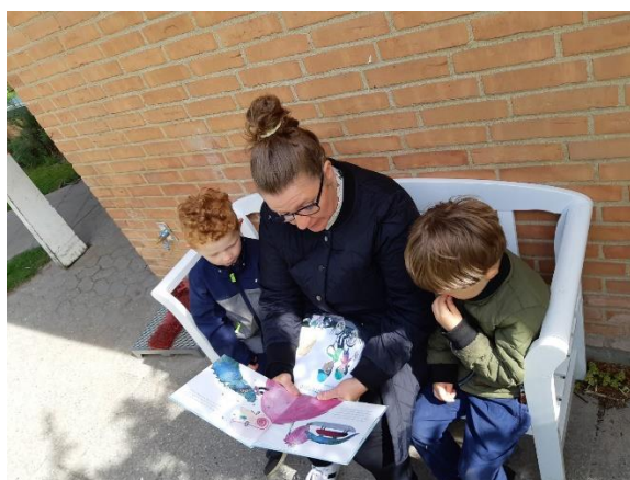
en hyggestund om en bog