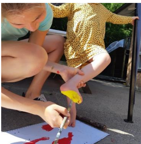
Fodmaling til vinduespynt. Det er lidt spændende at få maling på fodsåler