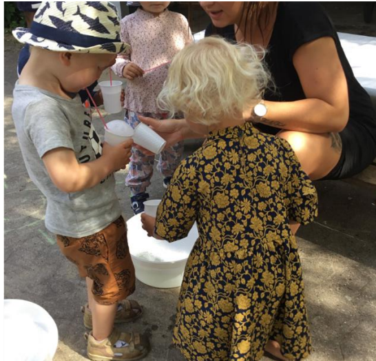
Udeliv kan også være kreative aktiviteter og leg med vand